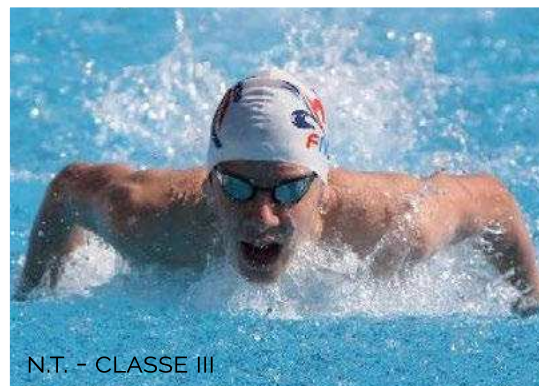
N.T. - CLASSE III