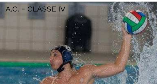
A.C. - CLASSE IV