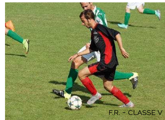
F.R. - CLASSE V