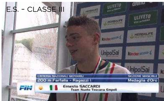
E.S. - CLASSE III