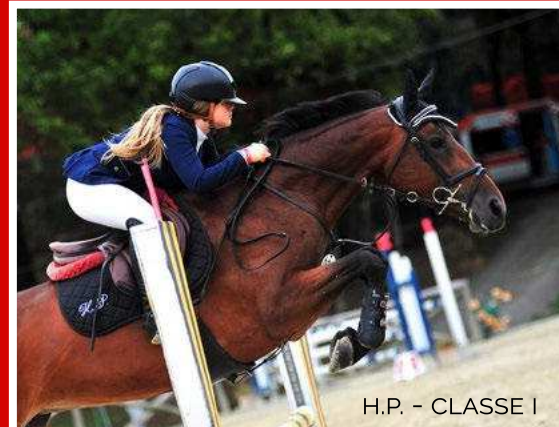
H.P. - CLASSE I