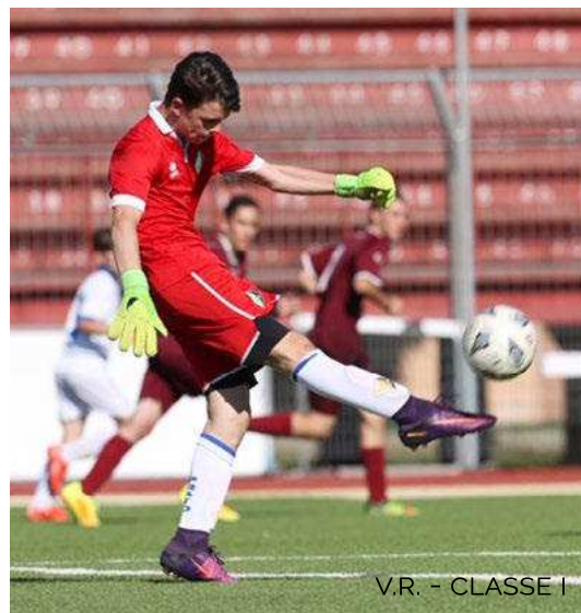
V.R. - CLASSE I