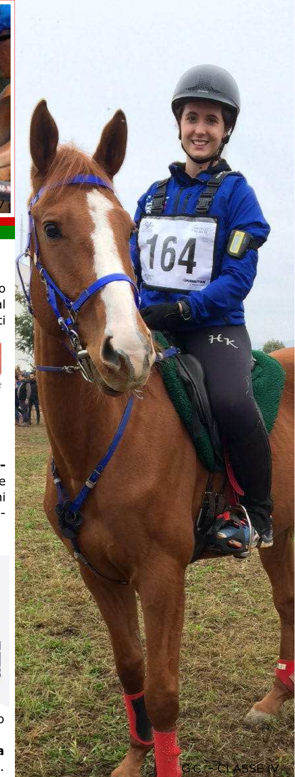
G.C. - CLASSE IV