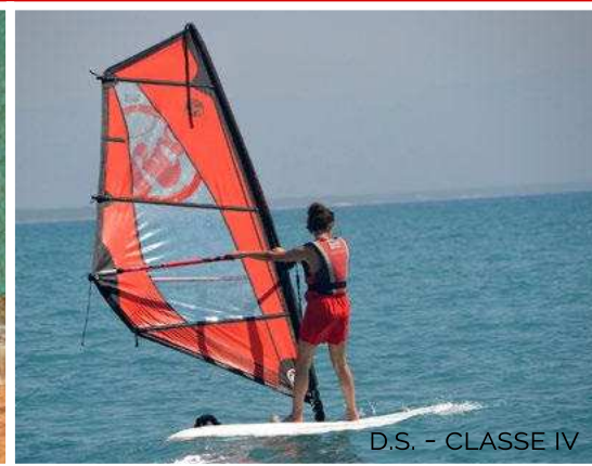
D.S. - CLASSE IV