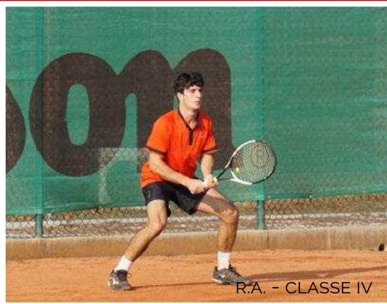
R.A. - CLASSE IV