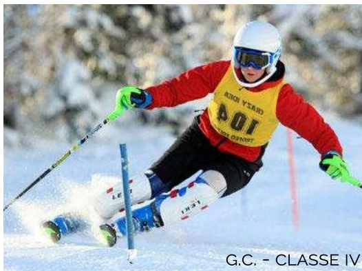
G.C. - CLASSE IV